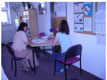
Jablonec nad Nisou